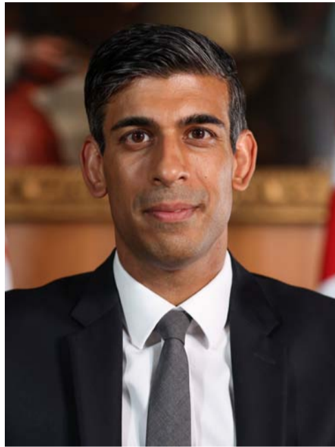
Premier Rishi Sunak. 10 Downing Street.

Mając w ten sposób niejako przygotowane przedpole do zmiany polityki klimatycznej premier przystąpił do akcji jej zaniechania. Czas, jaki ku temu wybrał jest symboliczny (20.09.2023), bo ogłoszenie odsunięcia na dalsze lata wszystkich restrykcji klimatycznych nastąpiło akurat w dniu, kiedy sekretarz generalny ONZ wystosował dramatyczny apel o podjęcie pilnych kroków w ograniczeniu wzrostu temperatury na świecie twierdząc, że człowiek otworzył „bramy piekiel”. Rishi Sunak nie weźmie udziału w posiedzeniu Zgromadzenia Ogólnego ONZ w Nowym Jorku, podczas którego narody mają ustalić cele zrównoważonego rozwoju. Nie będzie także towarzyszył królowi podczas jego wizyty państwowej we Francji, gdzie brytyjski król będzie gospodarzem forum zwołanego do podjęcia działań w sprawie emisji. Jak z tego wynika brytyjski premier ma akurat odwrotne zdanie w tej sprawie, aniżeli światowi liderzy. Tym, co mogą być zaskoczeni tak radykalną zmianą brytyjskiej polityki klimatycznej, trzeba przypomnieć doktrynę polityczną tego kraju, która twierdzi, że Wielka Brytania nie ma przyjaciół, ma tylko interesy. Te zaś realizuje nie zważając na żadne opinie, czy przeciwności płynące z innych krajów.