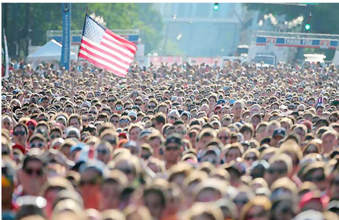
Coraz trudniej jest widzieć Amerykę jako lśniące miasto na wzgórzu, światło dla innych narodów.

„Dewaluacja małżeństwa, dzieci i patriotyzmu, skupienie się na „samorealizacji” i pieniądzu są oczywiście oznakami kultu-